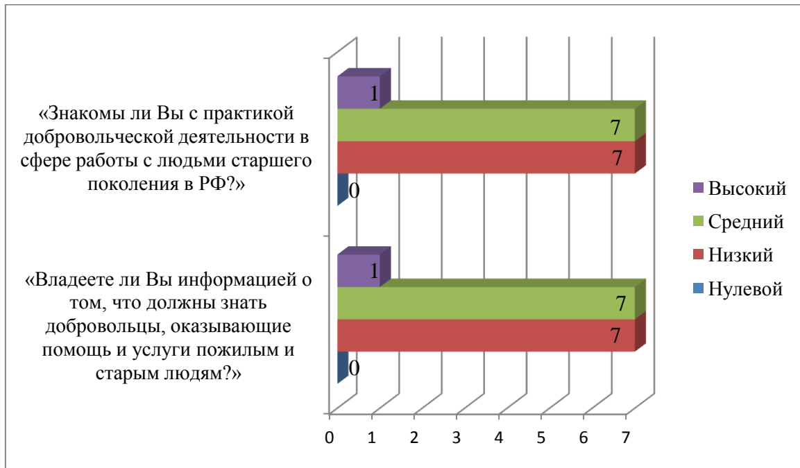
Рис.1. Уровень владения информацией о добровольческой деятельности